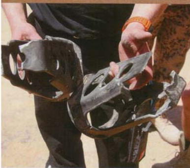
Alexandra und Olaf Seip im Pech: Ihre Engage-Stoßdämpferdome auf Etappe zwei zerfelzt.